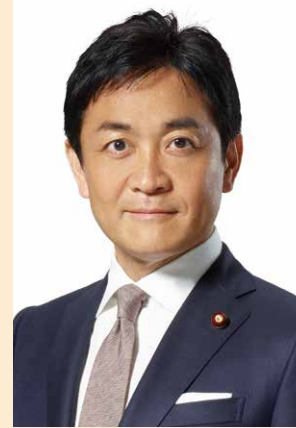
玉木 雄一郎氏 国民民主党代表・衆議院議員