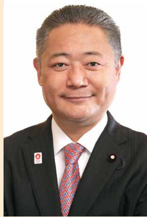
馬場 伸幸氏 日本維新の会代表・衆議院議員